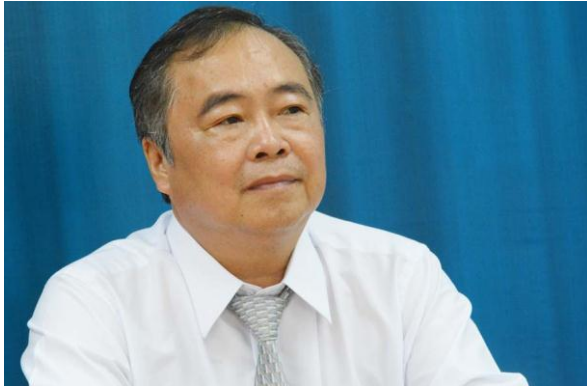
Trưởng ban tổ chức