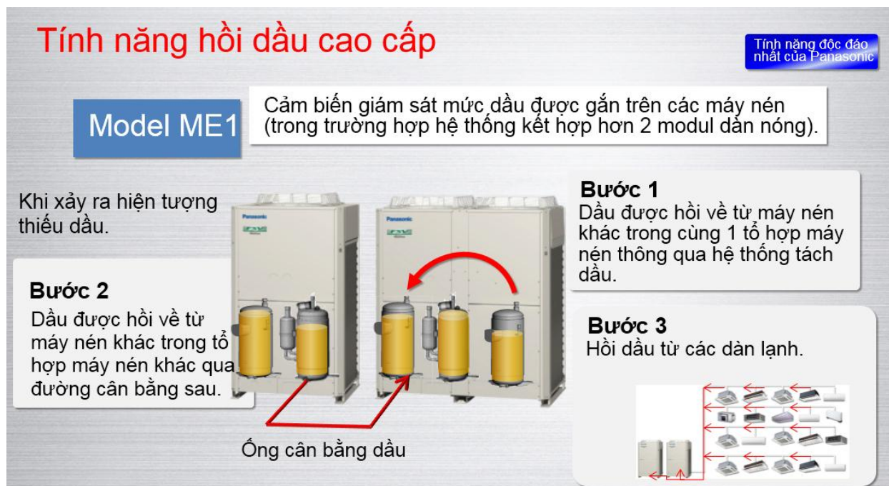
Hình 3: Mô tả công nghệ hồi dầu 3 bước

Tính năng này rất hữu ích, vì khi hút dầu từ dàn lạnh về, thì máy nén sẽ phải chạy hết công suất, van tiết lưu phải mở rộng 100%, quạt dàn lạnh ngừng hoạt động. Điều này sẽ dẫn đến: